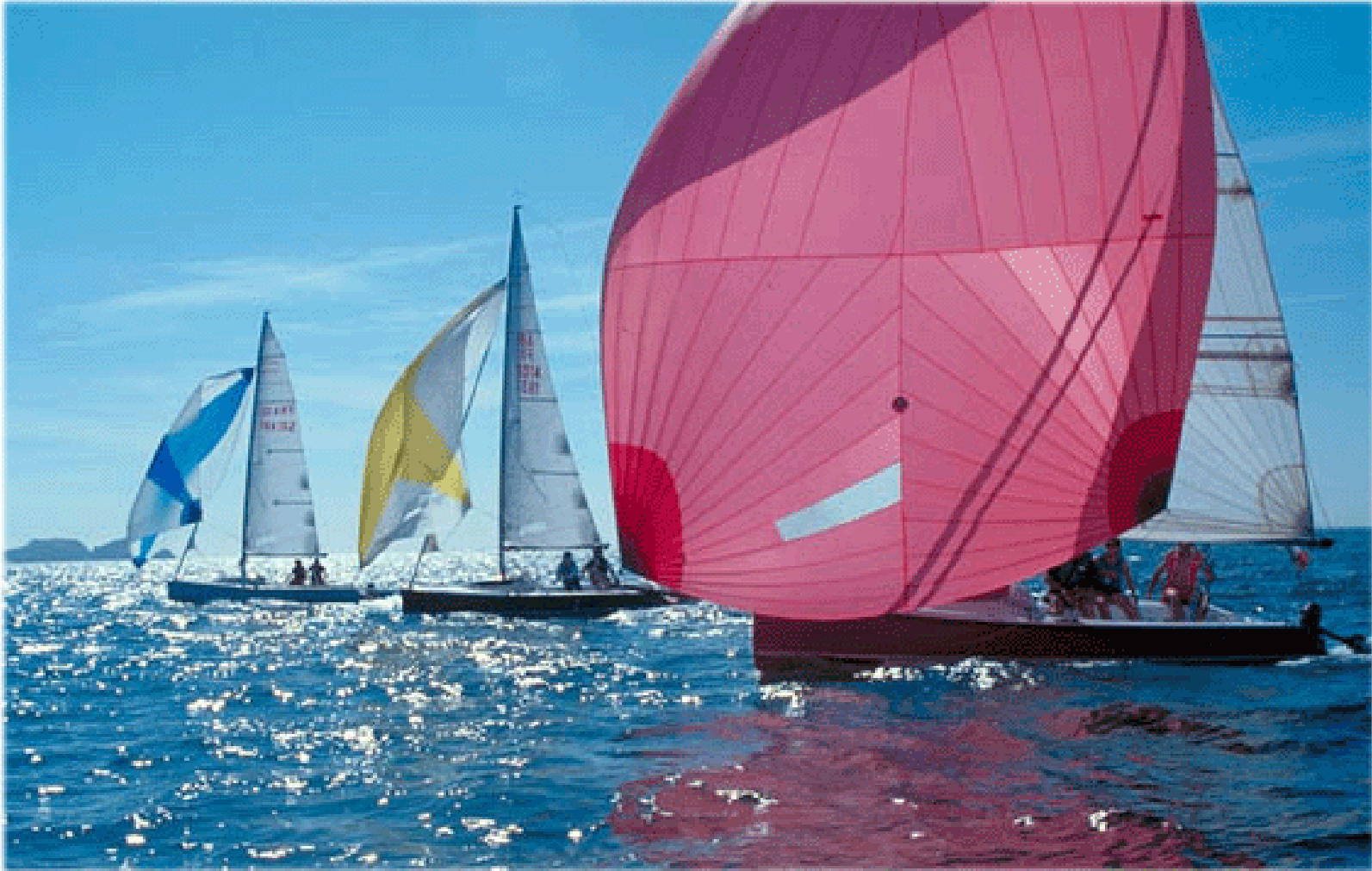
Barco usado para Escuela de Team Building - Archambault Sprinto 6,60